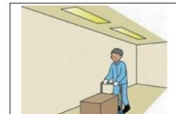
通路を含め作業場所の照度を確保する