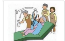
リフト、スライディングシート等を導入し、抱え上げ作業を抑制